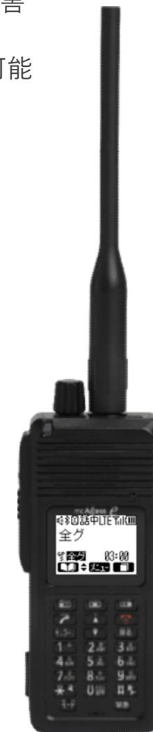
携帯型無線機（イメージ）